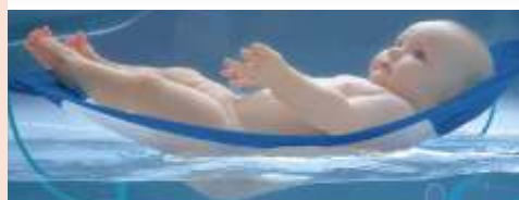
Được phép của: BABY AND CHILDREN

hoặc bằng cách cấp li-xăng đối với kiểu dáng đó. Thành công của sản phẩm đó là rất đáng kể. Loại vớng đó đã trở thành một trong các sản phẩm hàng đầu của BABY AND CHILDREN và công ty này, nhờ độc quyền có được từ việc bảo hộ kiểu dáng công nghiệp, đang tiêu thụ sản phẩm của họ trên khắp thế giới.